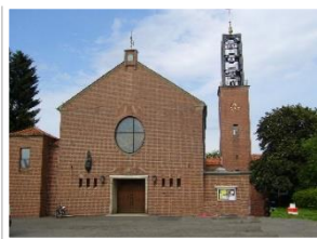
Ortskirche St. Norbert Friedland