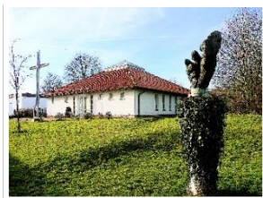
Ortskirche Hl. Kreuz Rittmarshausen