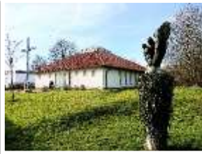
Ortskirche Hl. Kreuz Rittmarshausen