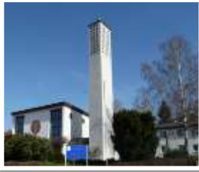
Pfarrkirche Maria Königin des Friedens Göttingen