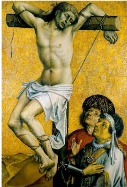
Städel-Museum, Frankfurt am Main, die Schächer zur linken Christi. Aus dem Kunstkatalog der Meister von Flémalle Rogeer van der Weyden