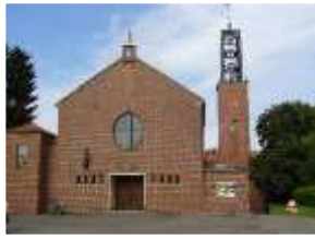
Ortskirche St. Norbert Friedland