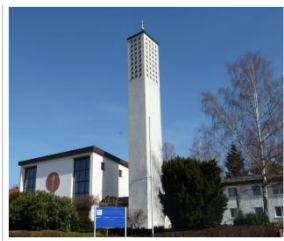
Pfarrkirche Maria Königin des Friedens Göttingen

Pfarrkirche Maria Königin des Friedens Sandersbeek 1, 37085 Göttingen-Geismar