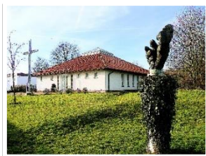
Ortskirche Hl. Kreuz Rittmarshausen