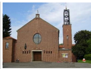
Ortskirche St. Norbert- Friedland