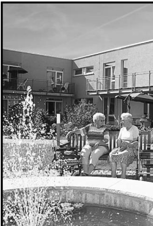
Max-Born-Ring 38 · Gö Tel. (0551) 5 00 93-0