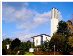
Pfarrkirche Maria Königin des Friedens Göttingen

Pfarrkirche Maria Königin des Friedens Sandersbeek 1, 37085 Göttingen-Geismar