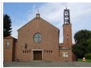
Ortskirche St. Norbert Friedland