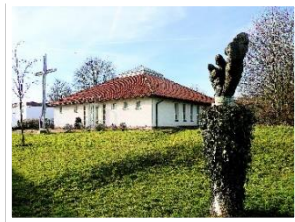
Ortskirche Hl. Kreuz Rittmarshausen

Ortskirche Hl. Kreuz Eckerberg 2, 37130 Gleichen - Rittmarshausen